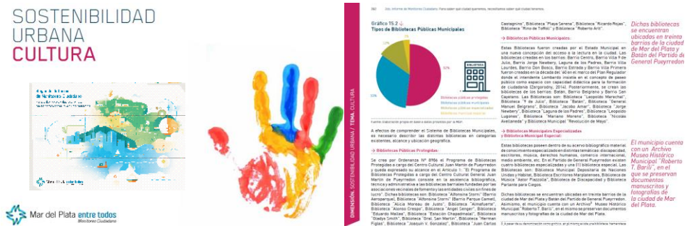
Imagen 2: Segundo Informe de Monitoreo Ciudadano.

En esta primera etapa se trabajó con Bibliotecas, Archivos y Centros de Documentación, Museos, Centro Culturales, Salas de Teatro, Ferias artesanales y Establecimientos deportivos con actividades culturales. La investigación de este tema nos permitió la transferencia a la comunidad a través del Segundo Informe de Monitoreo Ciudadano - Mar del Plata entre todos (imagen 2). Esto nos permitió, clasificar los mismos y verificar la vinculación con el patrimonio cultural del partido.