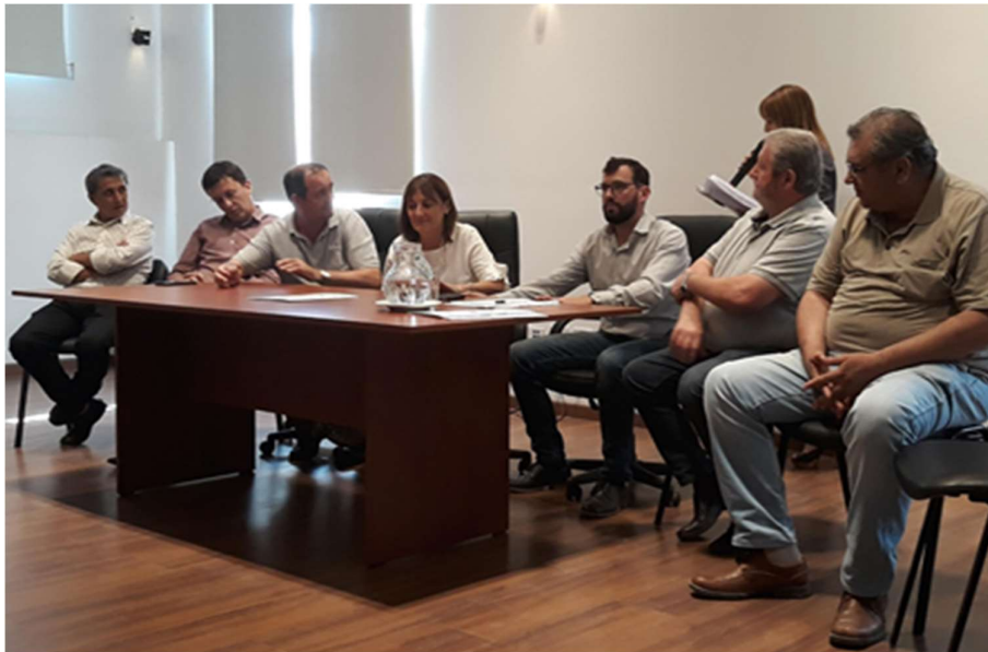
Figura N°2. Firma del Acta Acuerdo PASFM. Participantes: Ministra de la Producción e Intendentes y Presidentes Comunes de localidades integrantes del Parque Agrario. Centro Operativo Ángel Gallardo INTA, Monte Vera. Fecha: 05 de diciembre 2018.