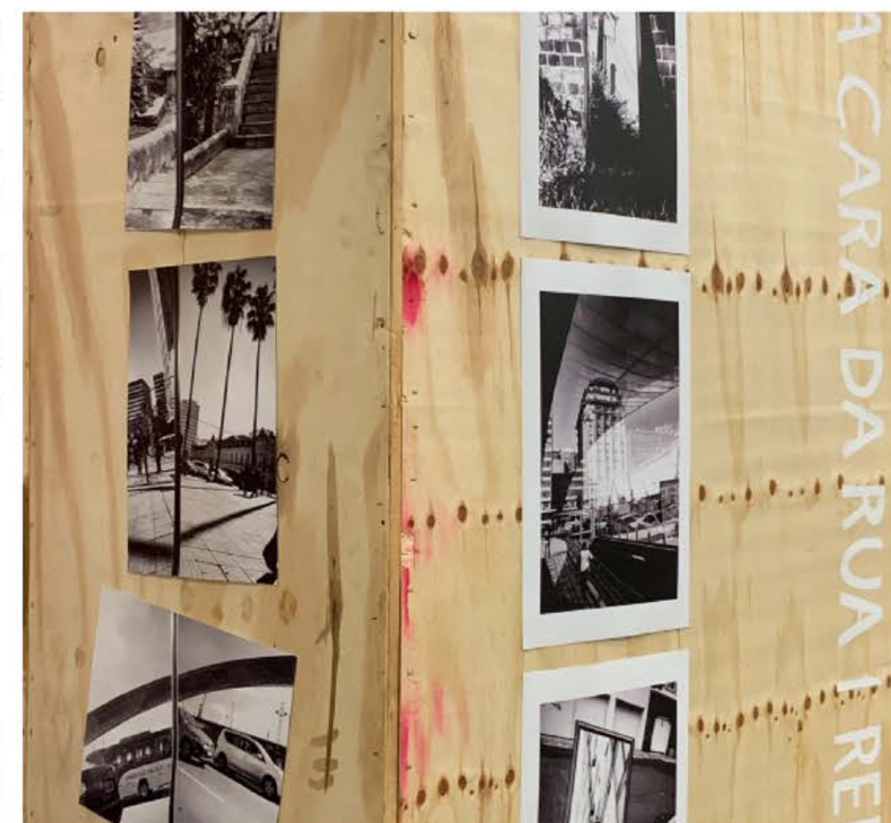
Exposição da Série Reflexos , maio de 2019. Espaço Expositivo, Instituto de Psicologia, UFRGS.