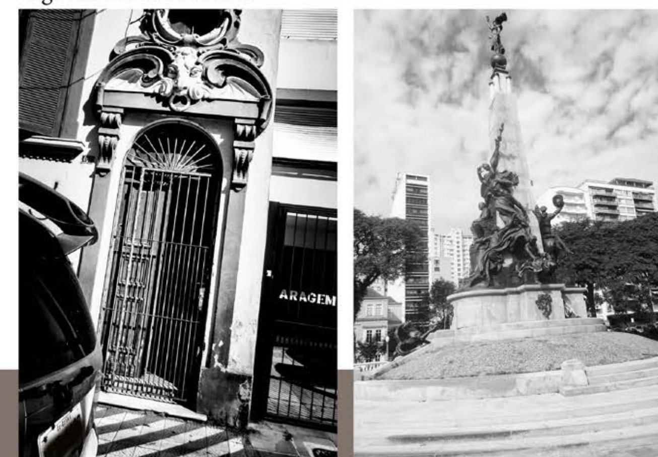
Série fotográfica Itinerários Afetivos , 2018. Produção de Postais vendidos pelos autores.