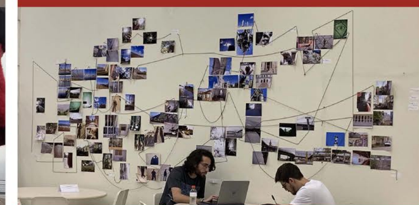
Itinerários Afetivos , Cartografia, 2019. Trabalho realizado pelo subgrupo "População de Rua" do Grupo de Pesquisa Experiências Urbanas e Produção do Comum realizado por professores e pesquisadores da Faculdade de Arquitetura e do Instituto de Psicologia da UFRGS.