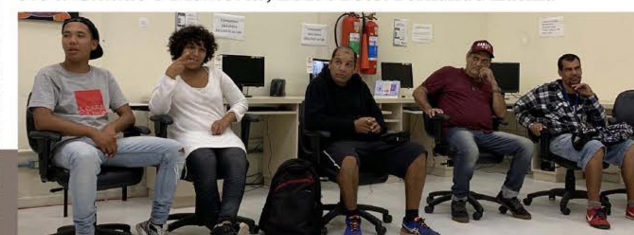
Alunos da EPA como debatedores no evento Narrativas sobre a Cidade e Memória , 2019.