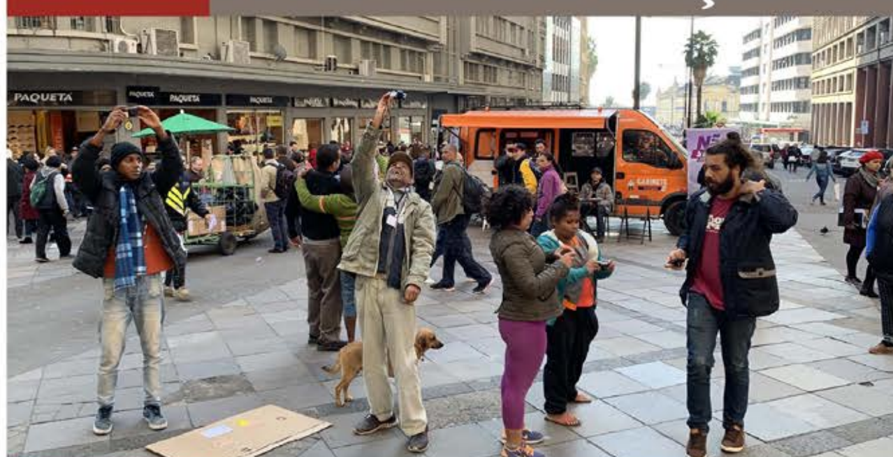
Atividade prática da oficina de fotografia na Esquina Democrática, centro de Porto Alegre.